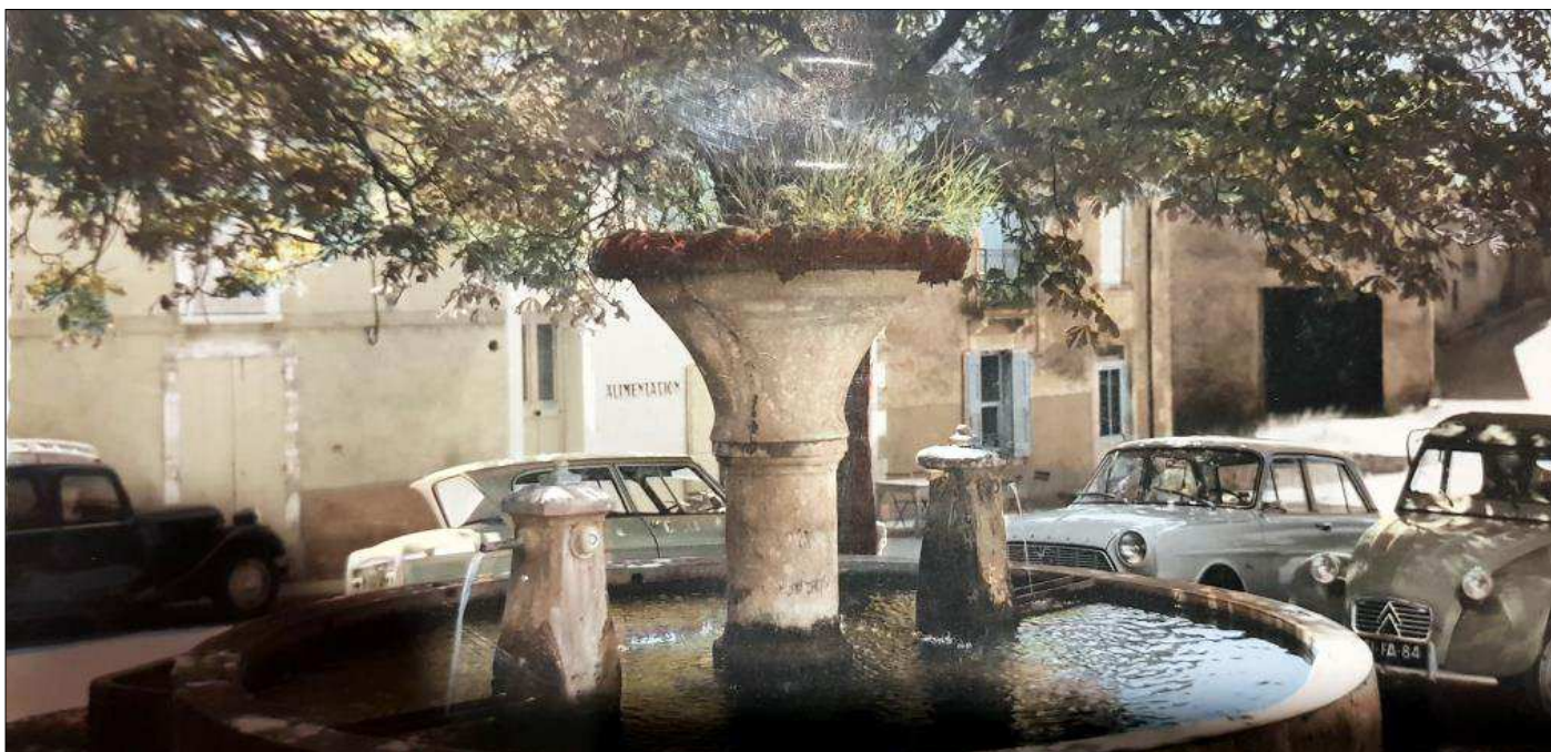
Fontaine de la place de la Mairie - Année 70