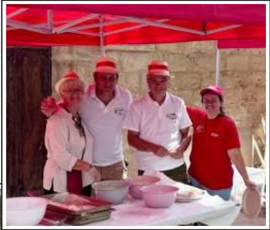
• Les 50 ans de l'Aïoli