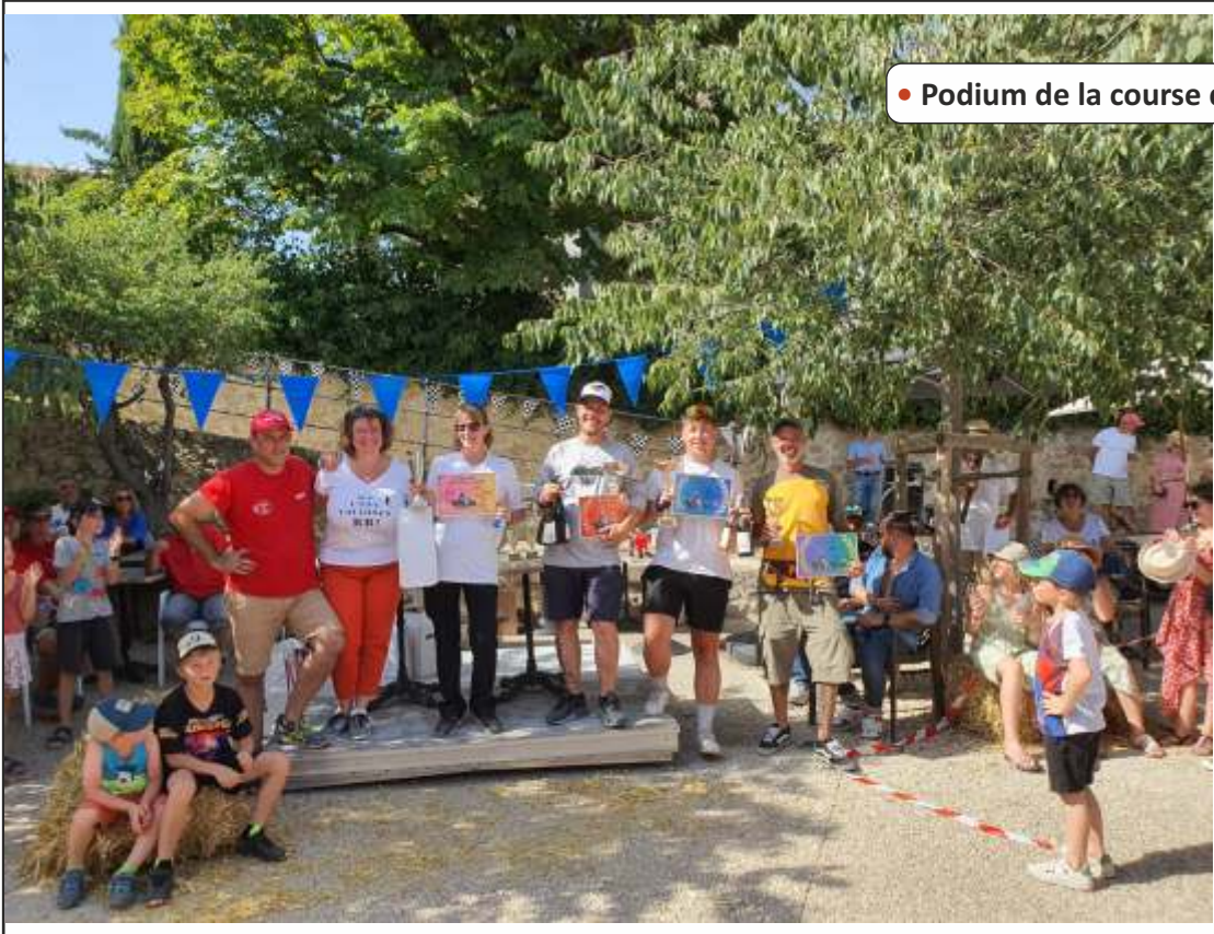
• Podium de la course de carrioles