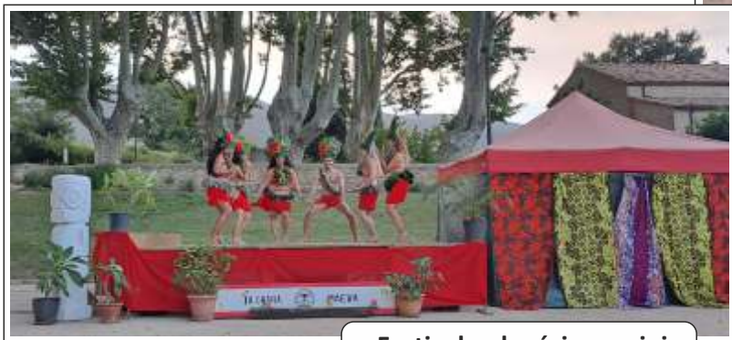
● Festival polynésien en juin