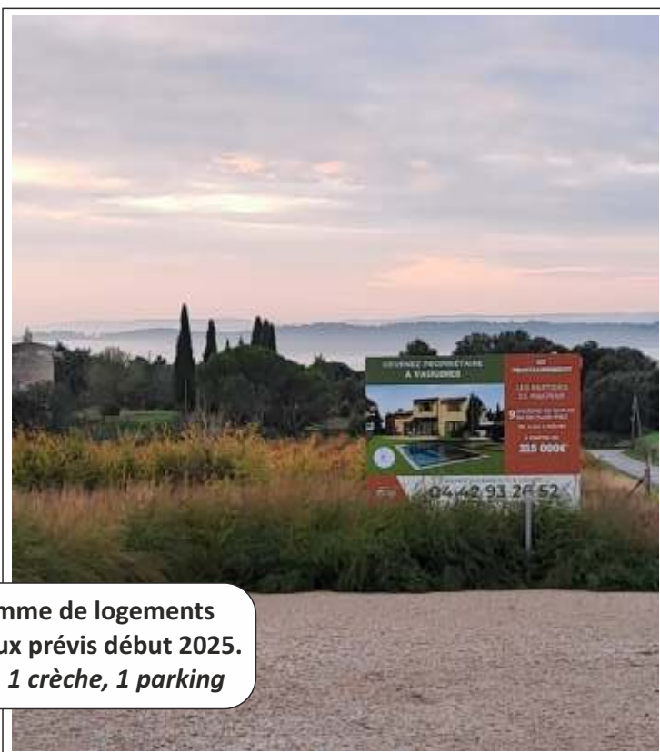
● Lancement du programme de logements chemin de Magnan, travaux prévus début 2025. 9 villas, 2 appartements, 1 crèche, 1 parking