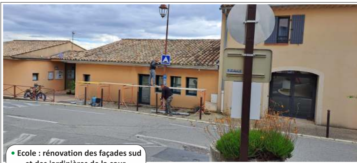
● Ecole : rénovation des façades sud et des jardinières de la cour, pose de gouttières côté nord.