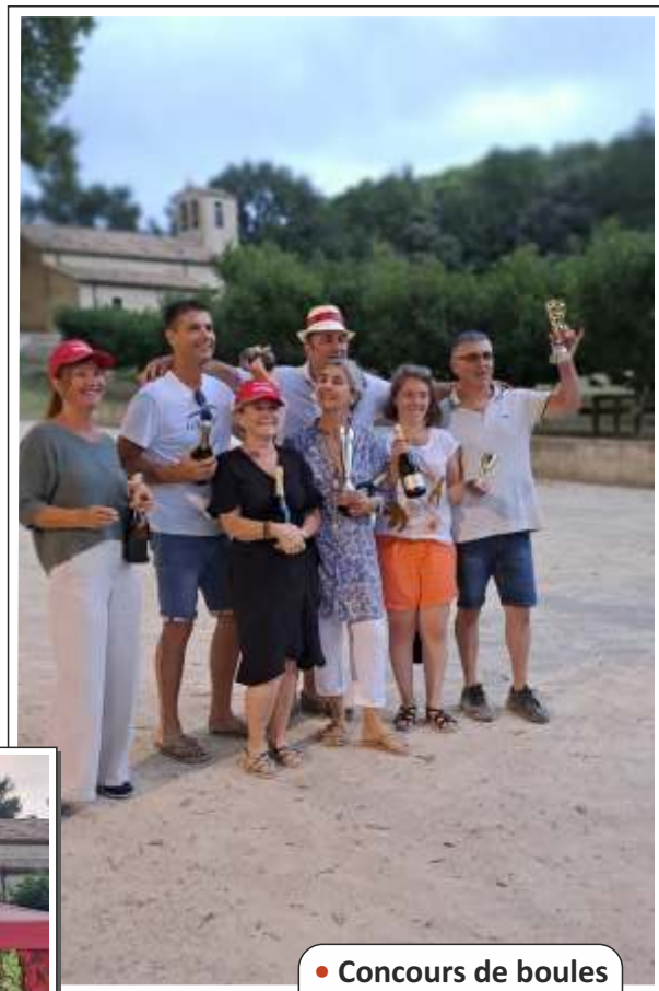
● Concours de boules Aïoli 2024