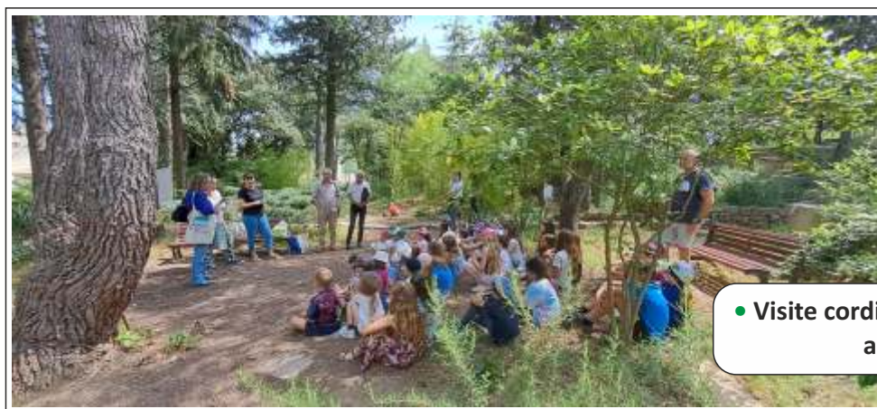
● Visite cordiale du jury des écoles fleuries au Parc de Georges.