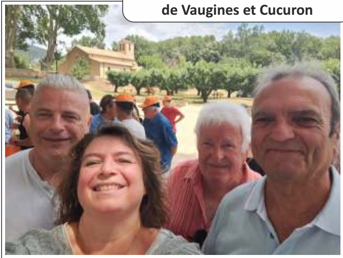
● 100 ans des sociétés de chasse de Vaugines et Cucuron