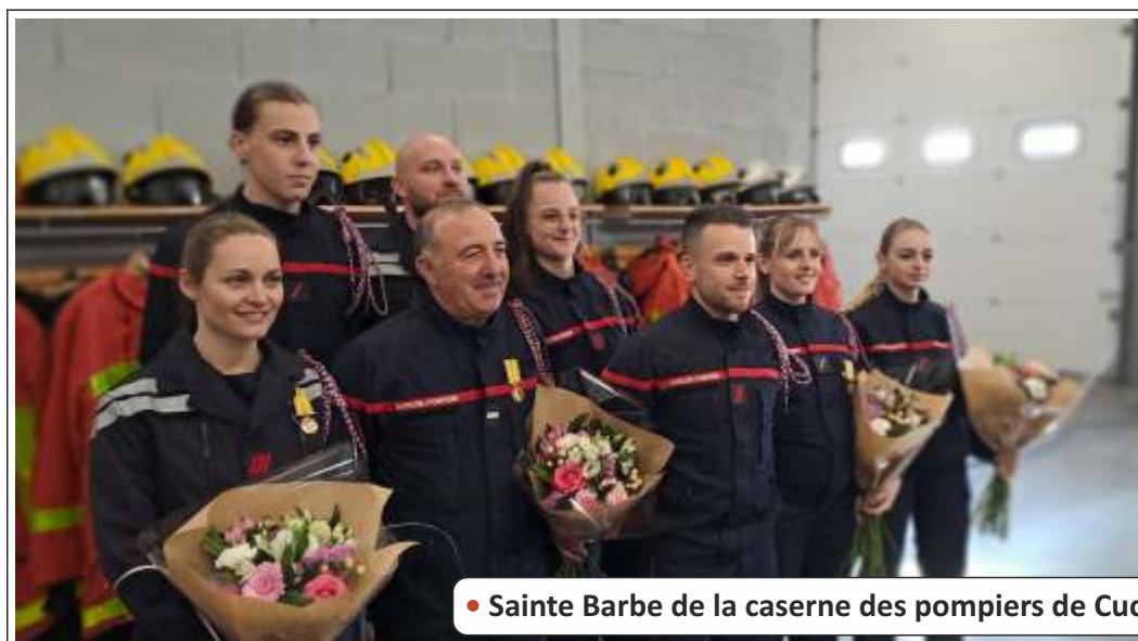
● Sainte Barbe de la caserne des pompiers de Cucuron