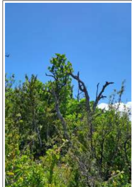
● Gestion de la forêt communale avec l'ONF, visite des parcelles et analyses qualitative des peuplements