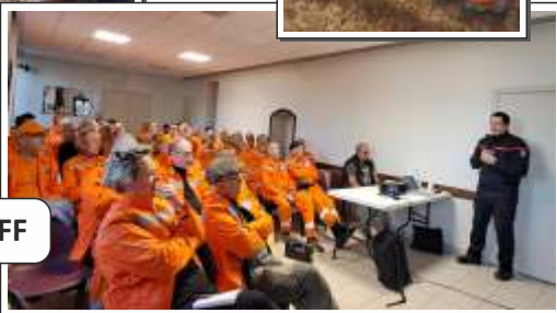
● Actions CCFF