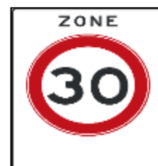
Cette photo par

Les rues du village ne sont pas un circuit de formule 1. La vitesse est limitée à 30km/h. Merci de penser à la sécurité de nos enfants qui circulent à pied ou à vélo.